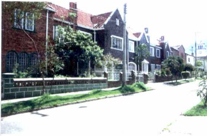
CRITERIOS DE CALIFICACION

✓ Representar en alguna medida y de modo tangible o visible una o mas épocas de la historia de la ciudad o una o mas etapas de la Arquitectura y/o urbanismo en el País.